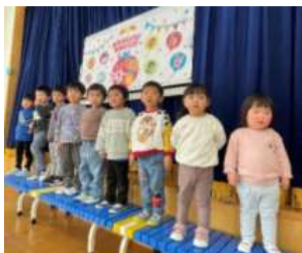
1・2月 お誕生会(1月23日) お話「てぶくろ」、鏡もち運びゲームも楽しかったね。