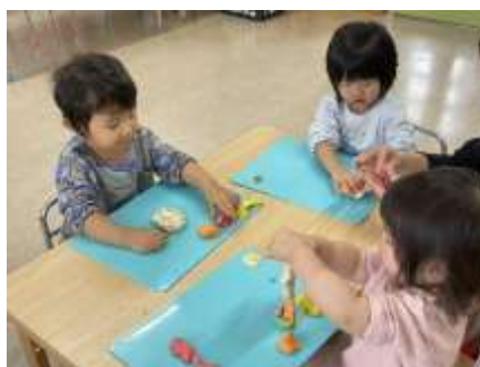
ハロールーム⑧(1月17日) “小麦粉粘土であそぼう”